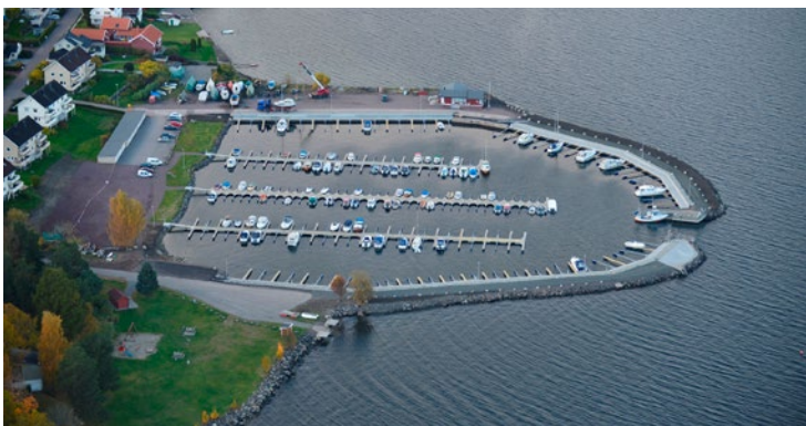
HOLMESTRAND - Hagemann.