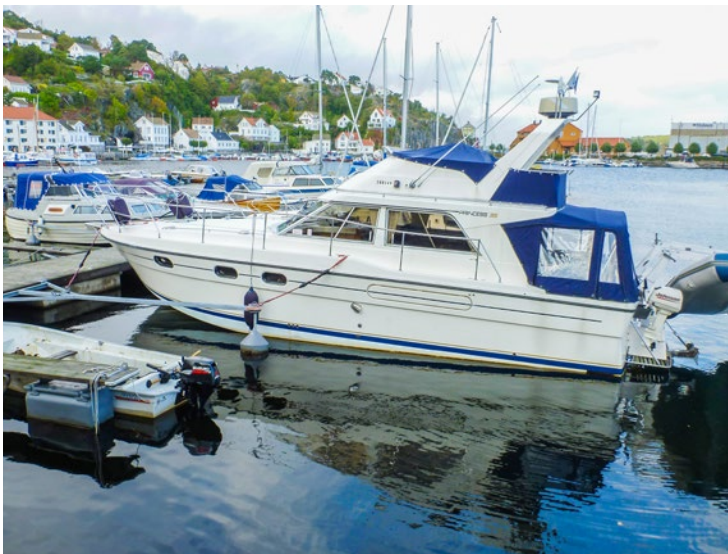
EN LITT FOR stor båt i forhold til utrigger.